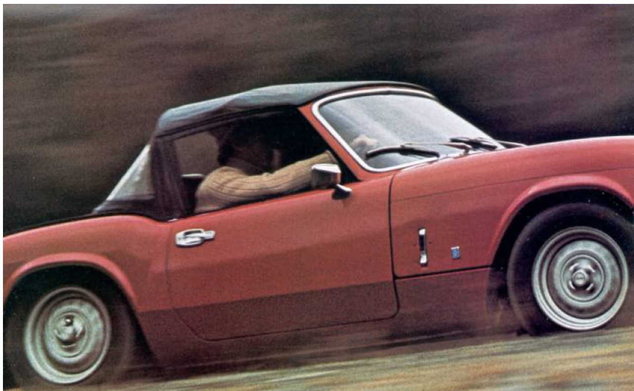
Brochure inglese della Spitfire 1500, 1975.

Dopo un estenuante studio delle brochure originali e di modelli uniproprietario e mai riverniciate, si è riusciti ad ottenere finalmente delle misure accurate per poter posizionare in maniera corretta il badge sulla carrozzeria.