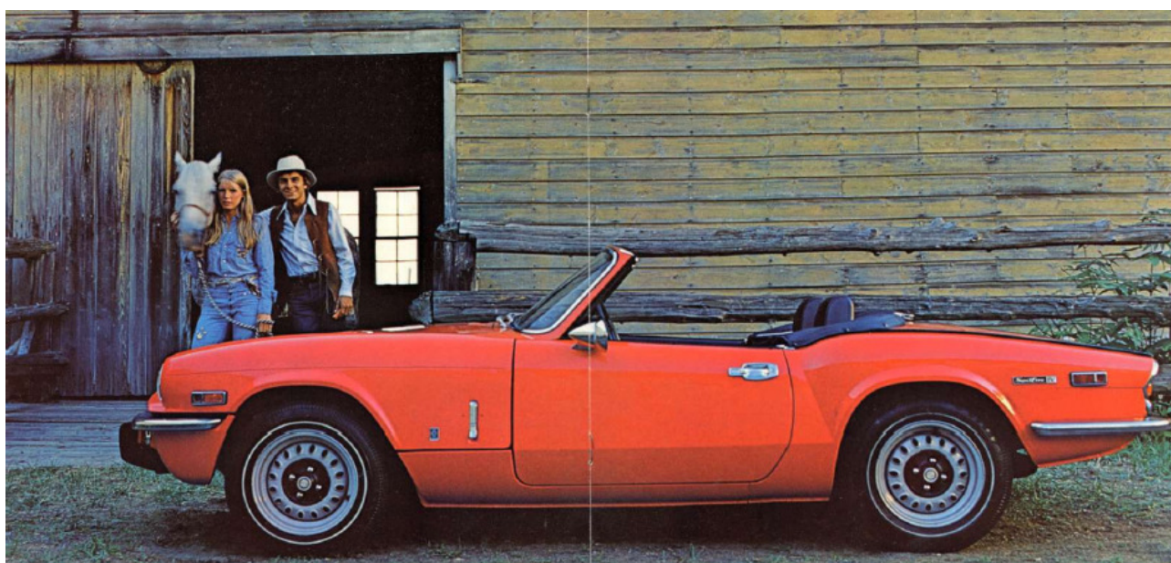
Brochure americana della Spitfire MkIV, 1972.

Come potete notare dalle immagini seguenti, il posizionamento corretto è sui parafranghi, centrato tra la maniglia di apertura cofano e il passaruota anteriore.