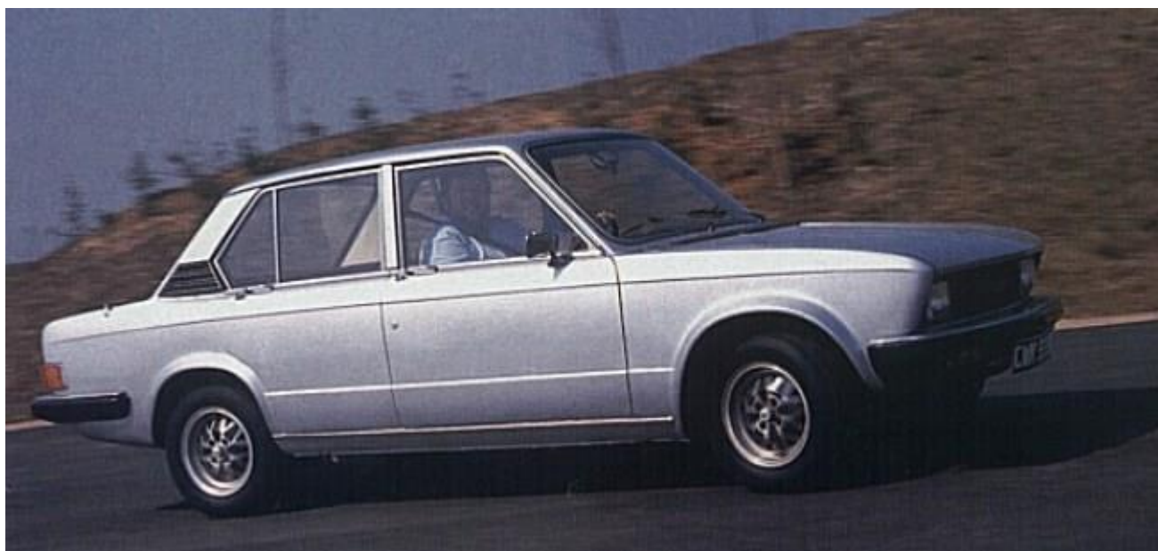
La proposta di Michelotti per la Triumph SD2 nacque come proposta di restyling per la Dolomite...

Secondo il documento di presentazione del concetto SD2, “Lo stile del veicolo è stato approvato dall’azienda nel settembre 1973 e i dettagli della gamma di versioni proposte, con le informazioni allora disponibili sulle specifiche del veicolo, il piano di fabbricazione, le implicazioni di mercato e le valutazioni finanziarie sono stati esposti in una domanda provvisoria presentata nel dicembre 1973” .