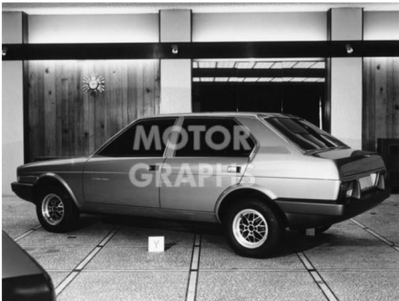
La versione Pininfarina della Triumph SD2 era elegante, sebbene riprendesse poco della Rover SD1 o della Dolomite che doveva sostituire.

Dove la SD2 deludeva era nella parte posteriore, con le ruote posteriori semi-nascoste e sezioni di plastica dietro i finestrini posteriori, montati sui modelli di fascia alta, che appesantivano la linea e stridevano con il resto dell’auto – la versione entry-level a sei luci era molto più pulita. Comunque sia, lo stile della SD2 fu approvato dall’azienda nel settembre 1973 e, a quel punto, sembrava scontato portarla in produzione.