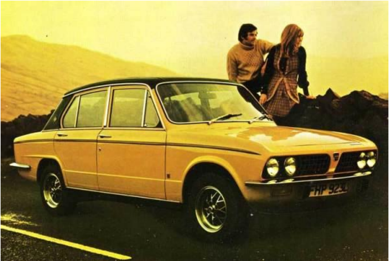
La Triumph SD2 fu concepita per rimpiazzare la Dolomite.

La SD2 venne concepita per sostituire la gamma delle piccole berline Triumph che all'epoca comprendeva le Toledo/1500TC/Dolomite 1850 e Sprint . Queste vetture, risalenti al 1965, occupavano un'interessante nicchia di mercato, un po' al di sopra della gamma Austin-Morris in termini di costo ma non di dimensioni.