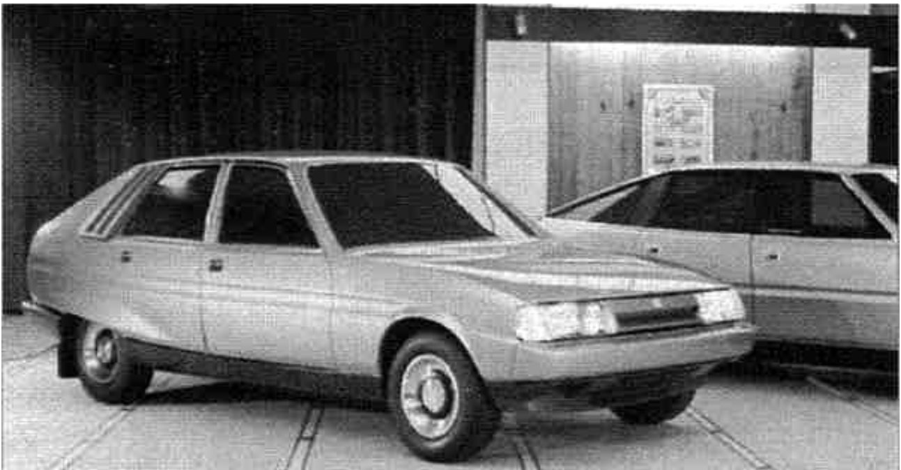
L'immagine sopra (1972 circa) mostra le due versioni SD affiancate per valutazione e confronto. Va detto che, in questa fotografia, lo stile non sembra così mal bilanciato come gli altri due ma, rispetto alla SD1, la SD2 non è ancora così ben proporzionata

Seguirono molte discussioni e, di fronte alla crescente resistenza interna, sembrò che il solo Spen King continuasse ad avere fiducia nel progetto SD2. Con il tracollo della BLMC nel dicembre 1974 e con il Rapporto Ryder che raccomandava la razionalizzazione di tutta la gamma, la condanna della SD2 fu inevitabile.