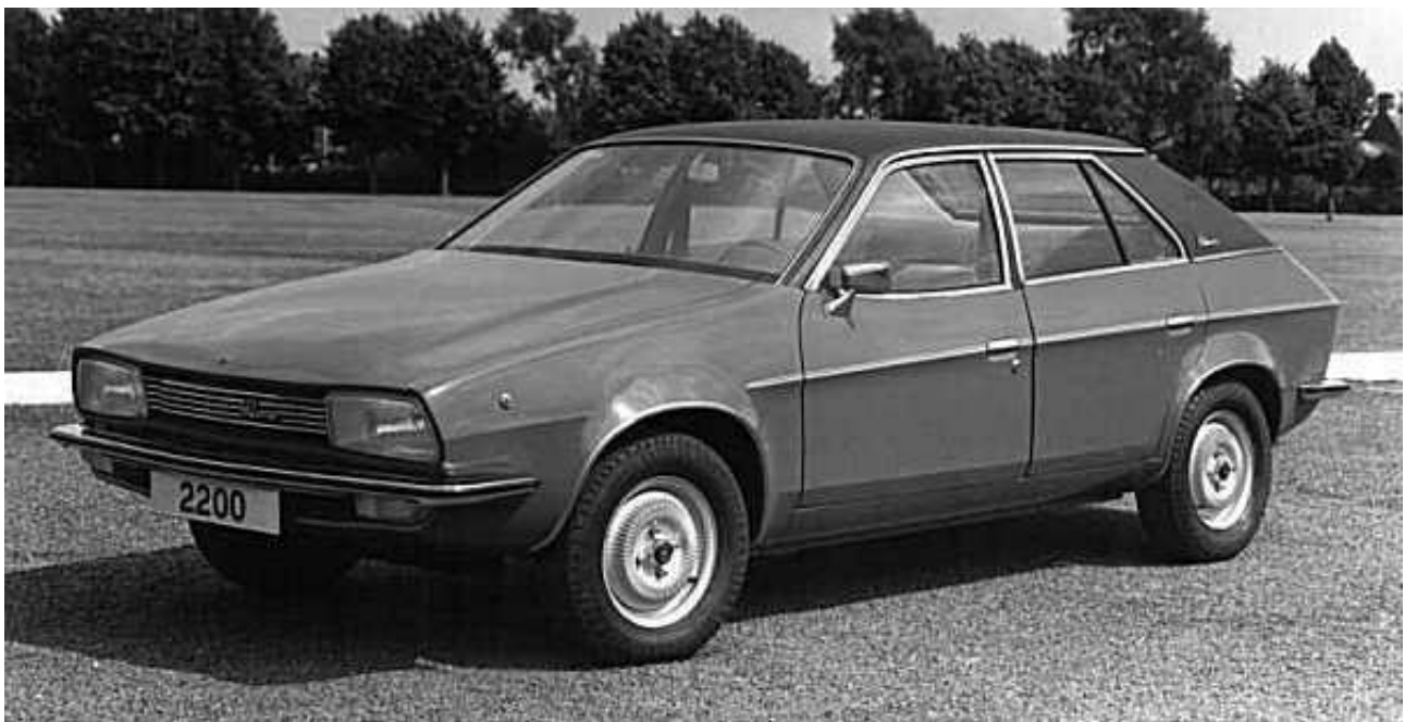
La Austin-Morris ADO71.

“È ragionevole presumere che una redditività di ‘livello A’ non sia un obiettivo prudente per la valutazione finanziaria”, affermava un documento interno. “All'altra estremità dello spettro, la redditività di ‘livello E’ probabilmente non è realistica. Il livello più ragionevole per una valutazione finanziaria prudente è tra questi due estremi, probabilmente intorno al 25%”.