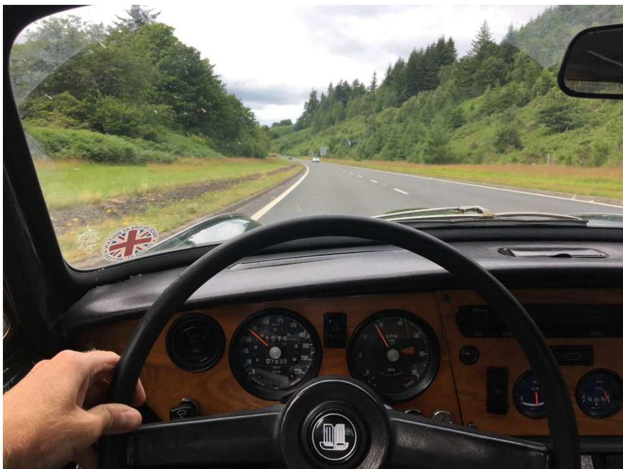
Guidando in Scozia.