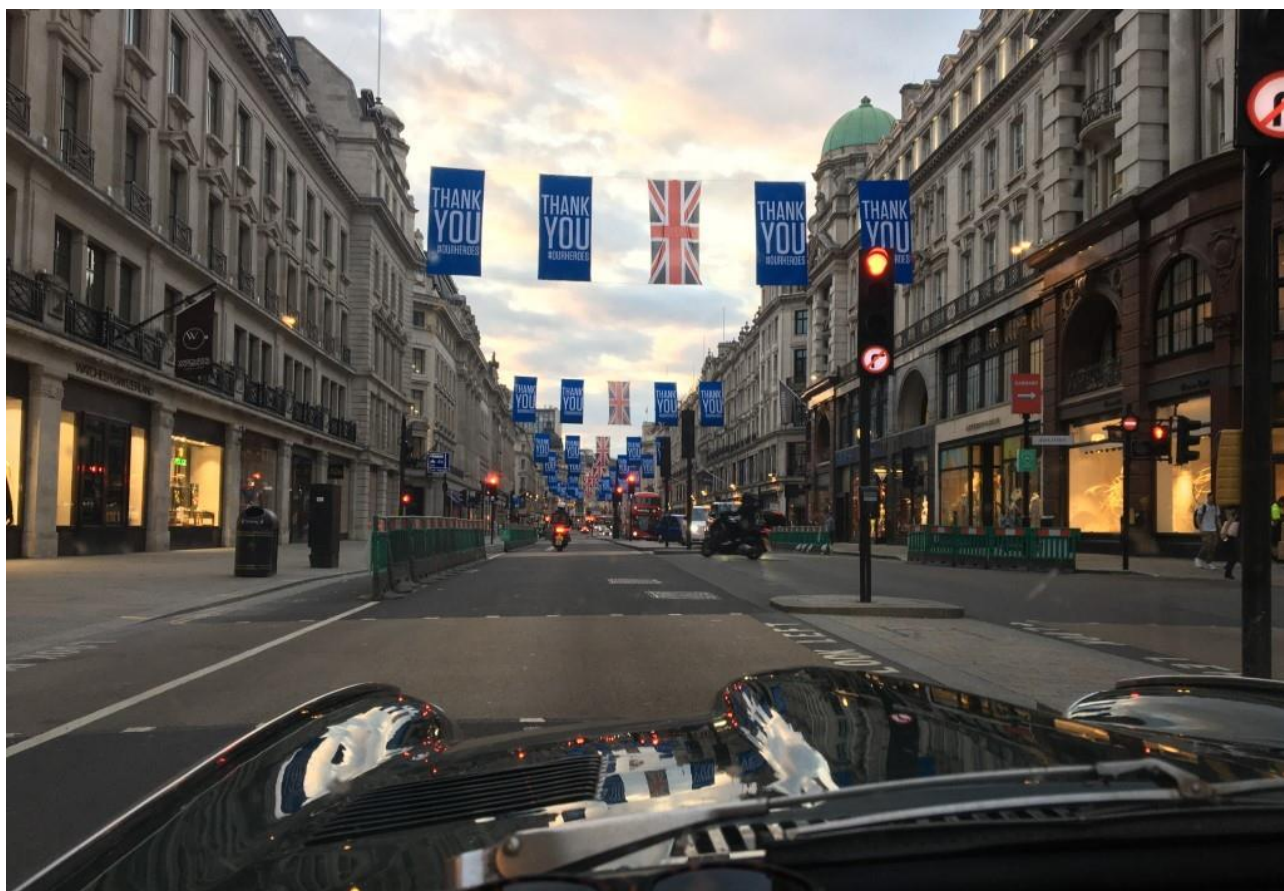
Una Londra insolitamente deserta.