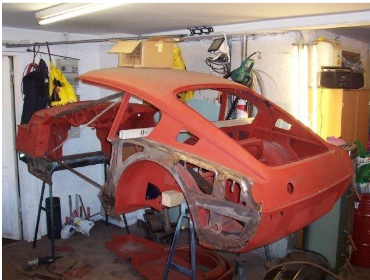
Restauro in corso.

Mi ci vollero 13 anni per ricostruire l'auto, lavorandoci in base al tempo libero e alla disponibilità di denaro, ma nel 2013 girai finalmente la chiave di accensione e misi in moto il sei cilindri in linea. Adesso guido la mia GT6 molto spesso e gira davvero bene. A 4000 giri in 4° marcia con overdrive arriva a 122 km/h e anche il tempo da 0 a 100 km/h non è affatto male per un'auto di 50 anni.