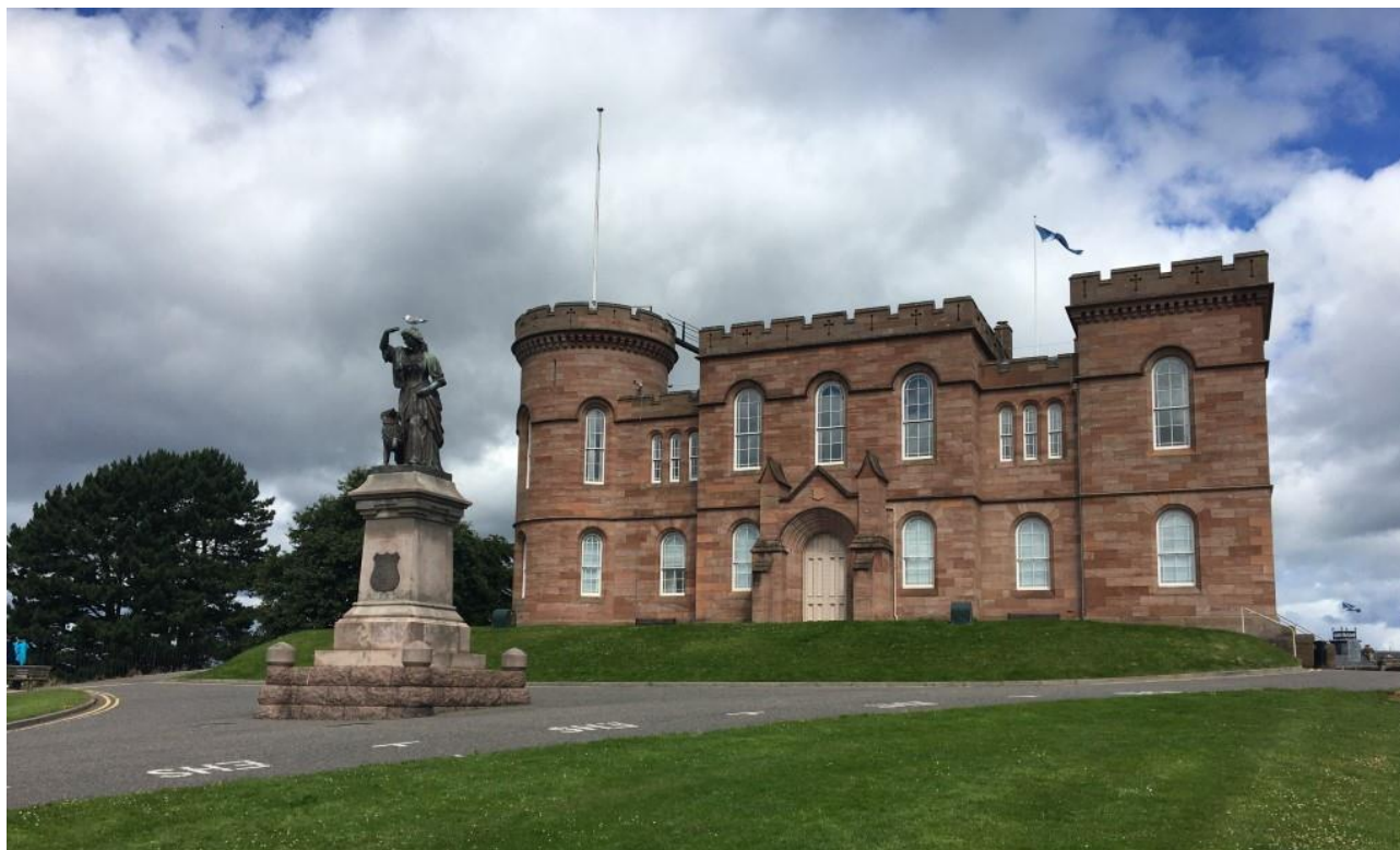
Panorami scozzesi (sopra e nelle pagine a seguire).