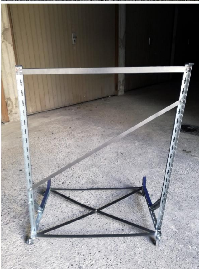
Il carrello completamente montato e con la gomma fissata.