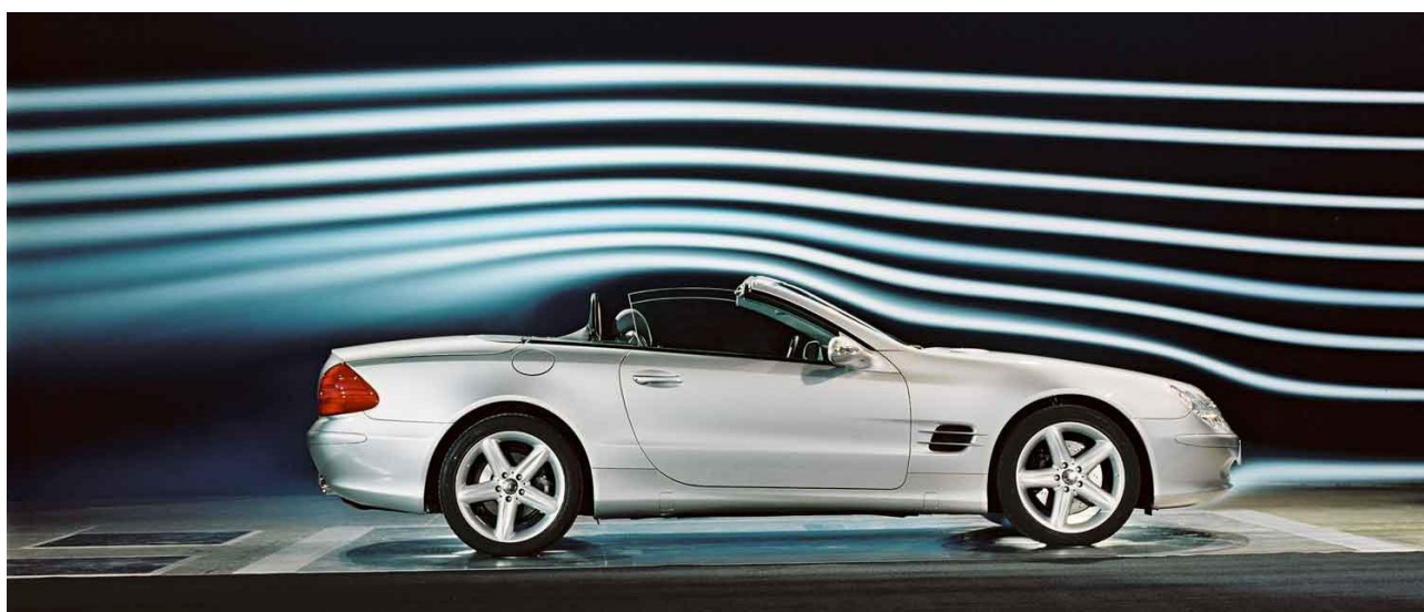
I flussi aerodinamici di una vettura aperta.

Non esiste nulla al mondo che renda gradevole una gita in auto quanto la sensazione di libertà regalata da una vettura aperta e dal vento che si insinua tra i capelli. A condizione di averli ancora, ovviamente. O che, specialmente per le signore, siano opportunamente raccolti o protetti da un copricapo. Ma anche quando i capelli non sono un problema, nelle serate di primavera o di fine estate non è insolito cercare un riparo dall'aria fresca che per un effetto aerodinamico ci colpisce alle spalle, raffreddando il collo e causando alla lunga delle spiacevoli cervicali.