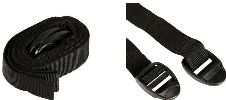
Le stringhe di fissaggio.

Reperire quanto sopra non è difficile dato che i fogli di plexiglass o di policarbonato si trovano in vendita nei negozi di bricolage anche se spesso di dimensioni molto maggiori a quelle necessarie per il nostro scopo, senza contare che dovremo poi provvedere da soli al taglio. Dovendo scegliere tra i due materiali, il policarbonato è più resistente a graffi e urti e riduce sensibilmente la tendenza a ingiallire con il tempo, a fronte però di un costo superiore. In alternativa al fai-da-te è possibile rivolgersi a qualche azienda in grado di fornire il prodotto già finito con una spesa tutto sommato equivalente e con un risultato molto probabilmente migliore. Le aziende che realizzano insegne pubblicitarie, per esempio, hanno i materiali e le competenze richieste. Le stringhe si possono trovare per pochi euro in qualunque negozio di articoli sportivi.