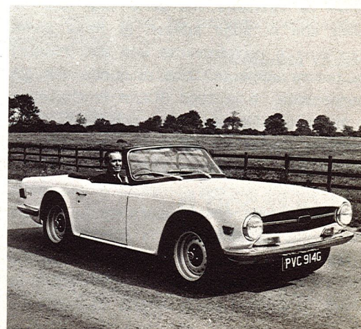
La Triumph « TR 6 P.I. » 2498 c.c. - 152 CV-DIN - 190 km/h.