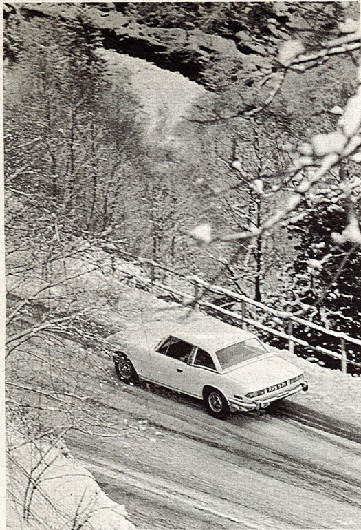
Una suggestiva inquadratura della Triumph « Stag H.T. ».

dei nostalgici amanti di vetture sport, perché le prerogative delle Triumph sono quelle che ogni buon automobilista desidera siano sulla sua automobile, delle caratteristiche giustamente « irrinunciabili ». Nella gamma Triumph, così completa, oltre alle già citate spyder, il coupé GT6 MK3 le berline 2000 e 2500 iniezione, troverete senz'altro la macchina per le vostre esigenze. Ora poi in Italia è arrivata anche la Toledo TC. Niente male dirà Vostra moglie nel vederla, niente male dirà Vostra suocera nel salirvi e scendervi in tutta comodità, esulteranno di gioia i vostri bambini nel « sentire » il motore di questa vettura: ma quello che ci preme più di tutto è il Vostro giudizio, il giudizio di un'automobilista competente che non si fa impressionare o convincere dalle chiacchiere degli amici ed è giusto, ma che si preoccupa di toccare con mano quello che gli si presenta: e allora coraggio! Una bella passeggiata con questa nuova 1500 due carburatori, di pura razza Triumph e poi la decisione che non può essere che una: ben arrivata Toledo TC!