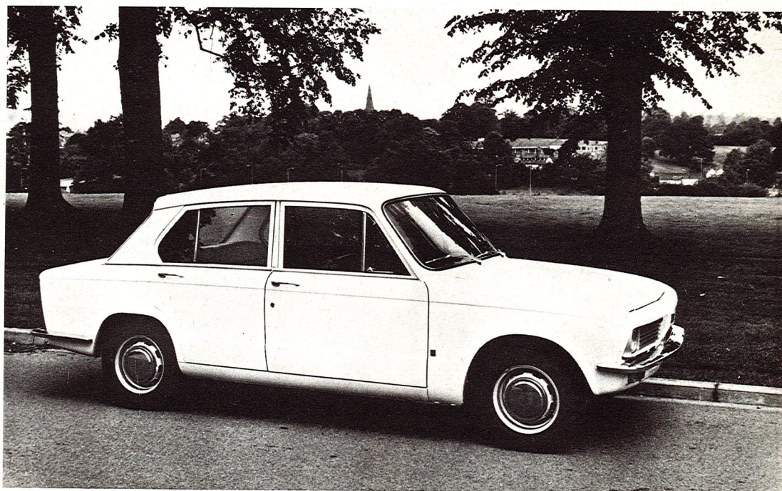
La nuova Triumph « Toledo 1500 TC » - 1493 c.c. - 65 CV-DIN - 145 km/h.

Il nome Triumph è normalmente legato a quello di modelli sportivi: è indubbiamente l'aspetto più noto di questa marca, ma non è tutto. Vi sono delle berline Triumph che, se pure fanno tesoro di tutte le esperienze acquisite nel campo delle vetture sportive, sono delle vere comode berline. Un po' di grinta, si sa, non guasta e le Triumph ne hanno tanta ma ben imbrigliata in scocche particolarmente ben studiate. Ciò che la Triumph vuole, nell'accingersi a produrre una qualsiasi vettura è soddisfare l'utente: ciò che vuole l'utente è normalmente il non essere costretto a cambiare marca di automobile quando ne ha alfine trovata una che lo soddisfi. Ma le esigenze di ogni automobilista cambiano continuamente con il passare degli anni. Dal piccolo spyder 2 posti « secchi », ad esempio lo Spitfire di quando si è ragazzi, si passa ad uno più grande come il TR6 iniezione o ad un 2+2 come la Stag: la neo-suocera non potrà nemmeno lamentarsi perché il posto per lei c'è: magari un po' scomodo per i lunghi viaggi, però sulla carta c'è e questo è l'importante!