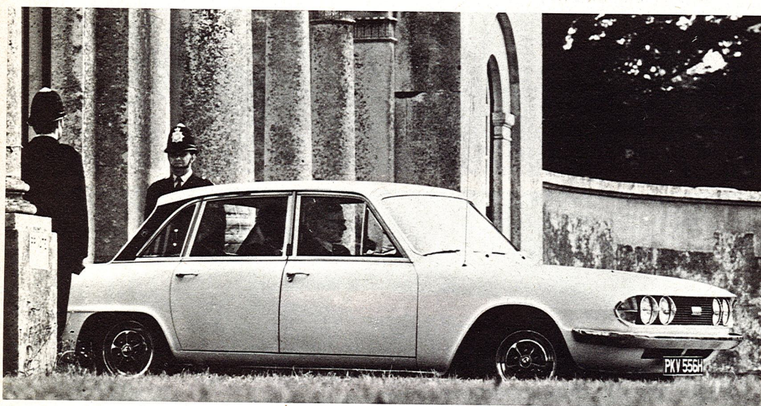
La Triumph « 2500 P.I. » 2498 c.c. - 132 CV-DIN - 175 km/h - alimentazione ad iniezione.