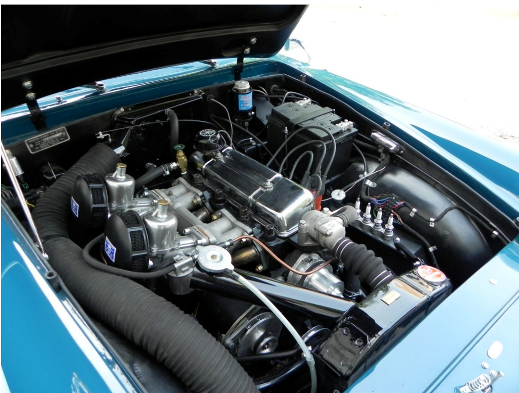
Ancora Ophelie, fresca di restauro.