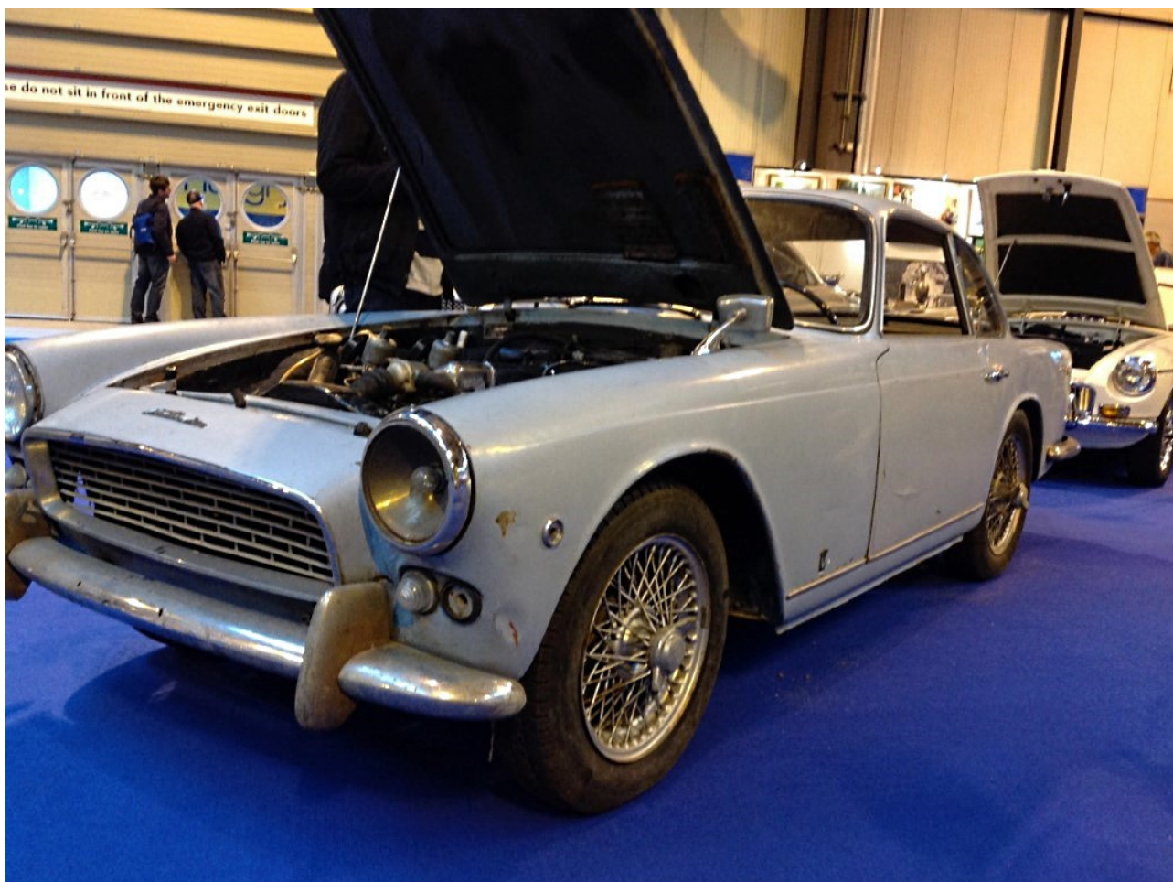
Birmingham, qualche ora prima dell'acquisto.

continuava a inserirmi nella lista dei desideri segreti e magici. Di nuovo, colpo di fulmine. Sono veramente malconcia: l'interno non è più originale, il colore nemmeno (ne porto tre strati diversi) mancano pezzi e pezzettini. Ho diverse ammaccature. Insomma, una ragazza stata bella, ma ben sfiorita. Altro che botulino... Lui cerca di negoziare pre-asta. Niente. Vado in asta e nessuno mi vuole. Fuori asta, lui fa un accordo diretto e divento sua. Ma sarò salva?