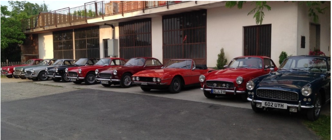
In primo piano a destra, ancora con le targhe inglesi, al raduno del Triumph Italia 2000 Register.

Eccomi qui, prima uscita a restauro appena finito nelle Langhe, al raduno delle Triumph Italia: per me, sono la più bella. Anche per lui, ma è facile, accecati dalla passione, non essere imparziali. Porto ancora la targa inglese 602 UYH che ha fatto da "ponte" tra Spagna e immatricolazione finale in Svizzera. Molte lodi per il lavoro svolto, molta curiosità. Le colleghe tedesche osservano, ma non commentano. Sarà invidia?